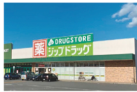
ココカラファインー身田店