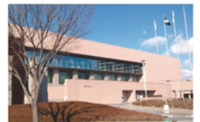
三重県総合文化センター