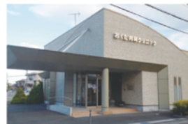
おくだ内科クリニック