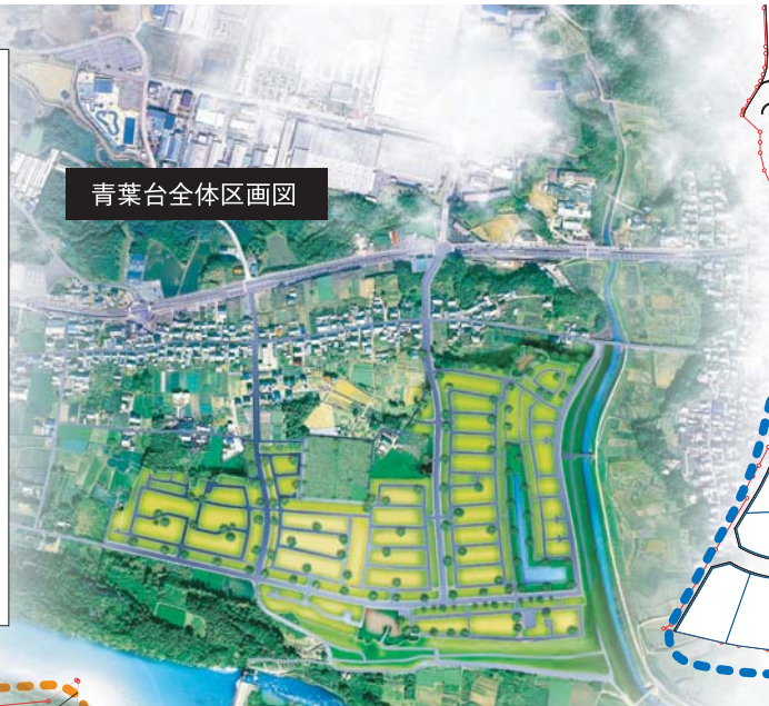
青葉台全体区画図